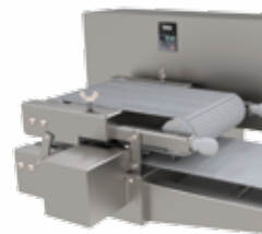
TABLERO DE CONTROL