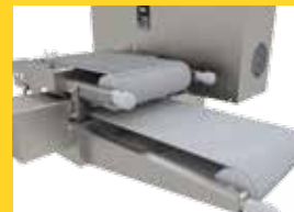
REGULACIÓN DEL ESPESOR DE FILET