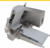
CINTAS CON GRIP