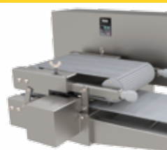
TABLERO DE CONTROL