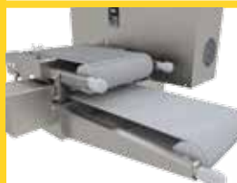
REGULACIÓN DEL ESPESOR DE FILET